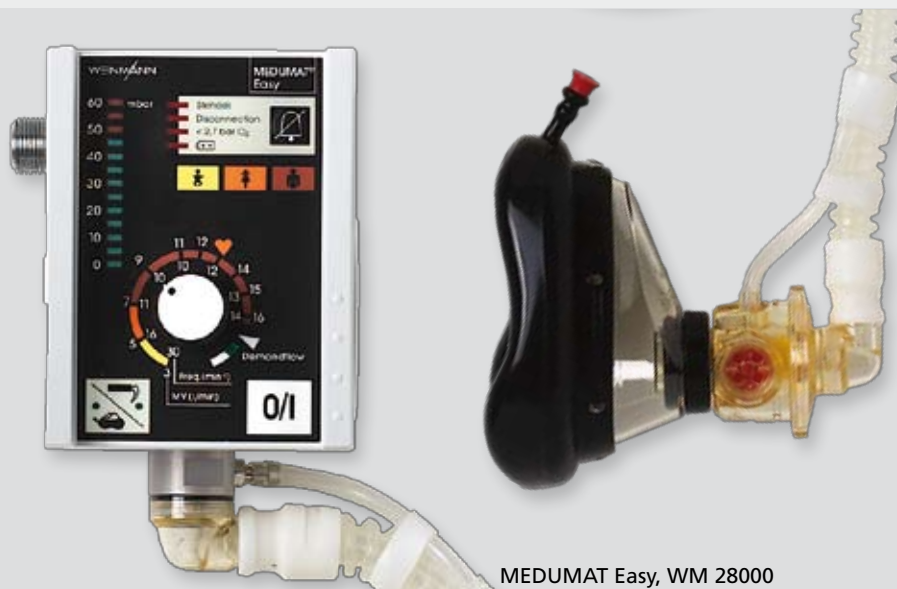
MEDUMAT Easy, WM 28000

MEDUMAT Easy ist extrem einfach und sicher zu handhaben. Trainierte Ersthelfer und First Responder kommen problemlos zurecht und können sich voll und ganz auf den Patienten konzentrieren. Per Sprachanweisung wird der Helfer in seiner Anwendung sicher unterstützt. Der Demand-Flow-Modus bei der Sauerstoffinhalation steuert die Zufuhr des Sauerstoffs und passt den Verbrauch dem Bedarf des Patienten an.