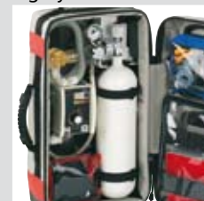
... und im Notfallrucksack RESCUE-PACK I