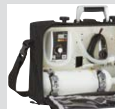
MEDUMAT Easy auf dem Tragesystem LIFE-BASE III...