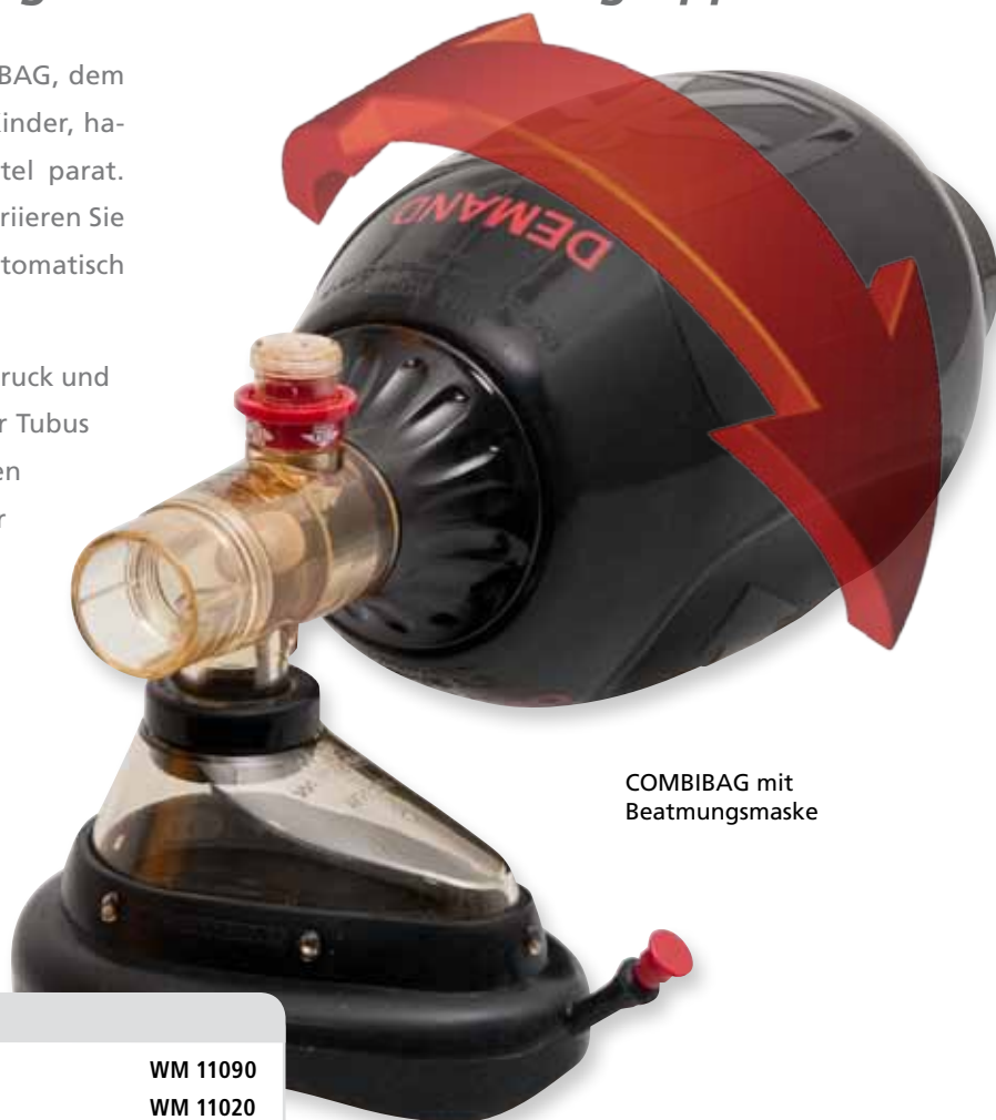
COMBIBAG mit Beatmungsmaske

Das Sicherheitsventil begrenzt den Beatmungsdruck und schützt den Patienten. Ganz gleich, ob Sie über Tubus oder Maske beatmen. Mit COMBIBAG gewinnen Sie Zeit, haben mehr Platz im Rettungskoffer und sparen auch noch Kosten.