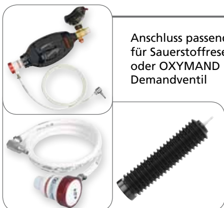
Anschluss passend für Sauerstoffreservoir oder OXYMAND Demandventil